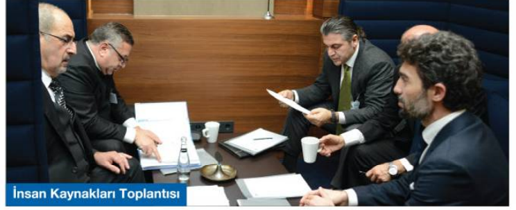
İnsan Kaynakları Toplantısı