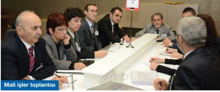
Mali işler toplantısı

10 Şubat 2015 tarihinde Şişli Marriott Otel'de yapılan öğleden sonraki interaktif toplantı bölümünde; dört ana çalışma grubuna ayrılan katılımcılar üretici şirketlerimiz arasında işbirliğini, bilgi ve teknoloji paylaşımını ortak akıl ve strateji üretme gücünü esas alan çalışmalar yapmışlardır.