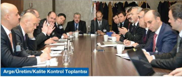
Arge/Üretim/Kalite Kontrol Toplantısı